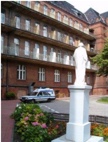
Budynek ul. Łąkowa