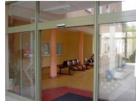
Budynek ul. Szamarzewskiego