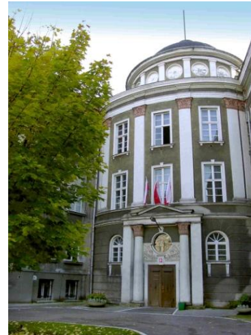
Budynek ul. Długa